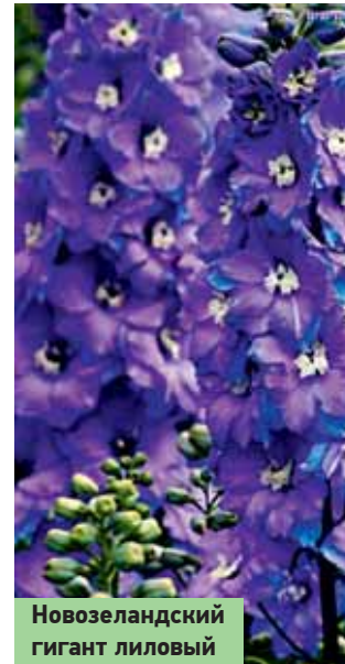
Новозеландский гигант лиловый

Следуя правилам выращивания дельфиниумов можно