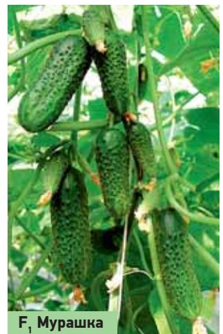
F 1 Мурашка

нее место в каталогах наших клиентов на следующий год. Селекционеры постарались и на грядках появятся крупноплодные, разнообразных форм и окрасок сорта и гибриды. Малиновый десерт, F 1 Розовый щербет, Инжир красный, Сибирский гигант, Первоклашка и др. Среди них будут и высокорослые, индетерминантного типа, а будут и очень низкие, выращиваемые