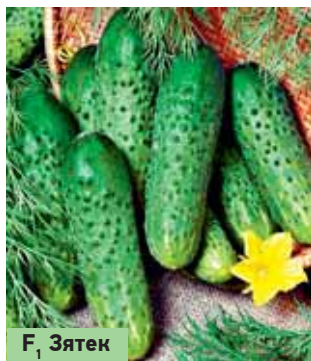
F 1 Зятёк

взойдённым по урожайности, товарности, потребительским качествам. С этим согласны и профессионалы-овощеводы и дачники нашей страны. Этот гибрид не нуждается в рекламе, его знают и любят многие огородники. Однако не уступит лидеру и целая группа замечательных корншонов букетного типа — F 1 Зятёк, F 1 Тёща, F 1 Мурашка, F 1 Щедрик, F 1 Лилипут. Радует