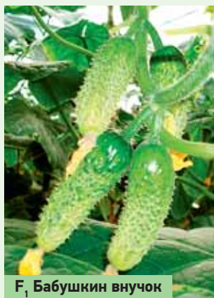
F 1 Бабушкин внучок

Часто, цветки одного узла распускаются один за другим, с разницей в день, а плоды развиваются одновременно и равномернее таким образом, что на растениях иногда можно наблюдать целый каскад наливающихся огурчиков (до 20-30 штук) различной вели-