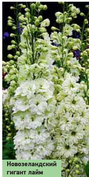
Новозеландский гигант лайм

Гибридные дельфиниумы обладают повышенной зимостойкостью и в условиях Подмосквы зимуют