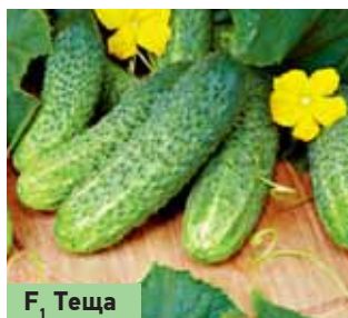
F 1 Тёща

Традиционно, и это вполне предсказуемо, лидером продаж остаётся огурец F 1 Кураж. Он остаётся непре-