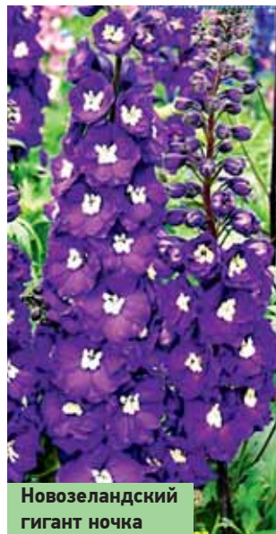
Новозеландский гигант ночка

Размножаются дельфиниумы семенами, делением куста, черенкованием. Всхожесть семян сохраняется в течение 2-х лет. Однако при хранении их в бумажных пакетах при комнатной температуре всхожесть теряется уже через год. Семена следует хранить в закрытом сосуде в холодильнике при температуре +5-6 °С. Посев проводят в несколько сроков: в конце марта-начале апреля в теплицу, весной в мае в открытый грунт и под зиму, по замёрзшей почве. Можно посеять в ящики зимой (в январе-феврале) и закопать в