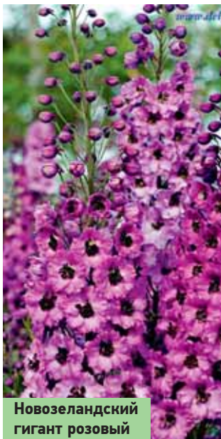
Новозеландский гигант розовый

снег. Семена пройдут естественную стратификацию при низких температурах и весной эти посевы дадут дружные всходы. Оптимальная температура развития семян +15-16 °С, а при +20 °С наблюдается угнетение проростков дельфиниума. Уход за дельфиниумами заключается в регулярных поливах со смачиванием почвы на