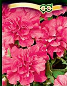
F1 ДУО РОЗОВЫЙ