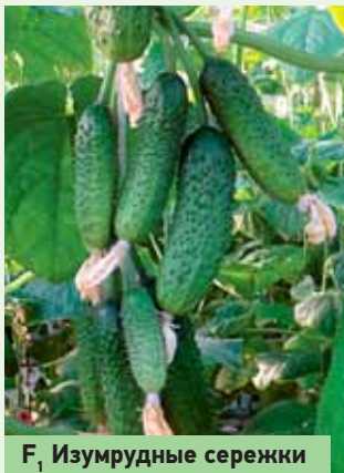
F, Изумрудные сережки

красивые темно-зеленые с опушением зеленцы. Такие огурчики вкусны, пригодны и для салата, и в баночку. Немаловажным качеством, особенно для тех, кто растит овощи не только для себя, является хорошая сохранность и транспортабельность зеленцов.