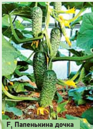
F, Папенькина дочка

Скороспелый партенокарпический гибрид женского типа цветения и букетного заложения завязей (по 2-3 в узле), предназначен для выращивания в открытом и защищенном грунте. Зеленец цилиндрической формы, темно-зеленый, длиной 12-14 см, массой 130-150 г, хрустящий, ароматный. Гибрид устойчив к настоящей мучнистой росе, оливковой пятнистости, толерантен к ложной мучнистой росе и корневым гнилям.