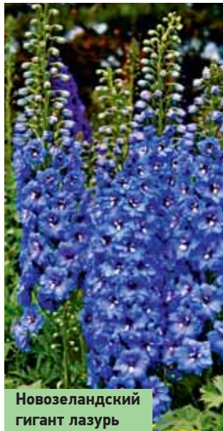
Новозеландский гигант лазурь