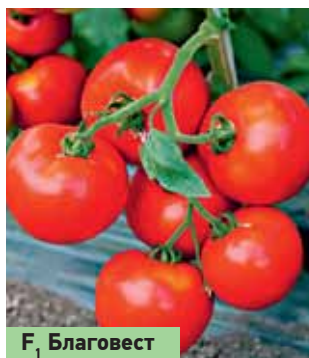
F 1 Благовест

Что мы планируем в следующем сезоне? Прежде всего новые гибриды огурца — F 1 Дедушкина внучка, F 1 Бабушкин внучок... Не будем заранее раскрывать все