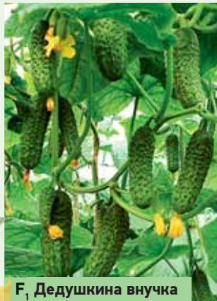
F, Дедушкина внучка

Скороспелый партенокарпический гибрид с букетным заложением завязей (3-4 в узле), с ограниченным ростом боковых побегов, женского типа цветения. Плоды цилиндрические, длиной 10-12 см, диаметром 3,5-4,0 см, массой 110-130 г, темно-зеленые с полосами средней длины. Поверхность плода крупнобугорчатая, расположение бугорков среднее, опушение черное. Вкусовые качества зеленцов отличные. Гибрид дает стабильно высокие урожаи даже при неблагоприятных условиях выращивания.