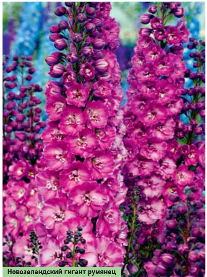
Новозеландский гигант румянец

Дельфы и отсюда получил своё название. Многообразие форм и сортов дельфиниума представляет простор для фантазии, позволяет создавать уникальные композиции. Например, ярко-голубой или розовый дельфиниум хорошо будет смотреться с хвойными различных от-