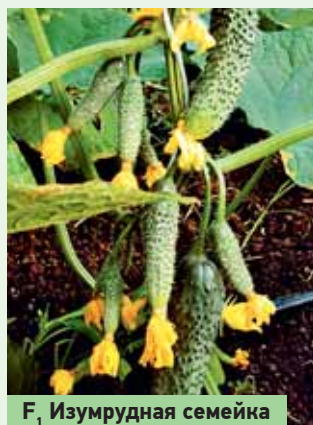
F 1 Изумрудная семейка

Выращивая эти огурцы приходится также следить за боковыми побегами. Но применяемая формировка достаточно проста. Для улучшения налива завязей удаляют все боковые побеги в начале их роста, тогда плодоношение идет на главном стебле. Этим приемом, в общем-то, и стоит ограничиться. В дальнейшем, к концу июля, когда сходит первая волна плодоношения, вновь отрастающие боковые побеги естественным образом формируются детерминантными, их еще называют «букетными веточками», ко-